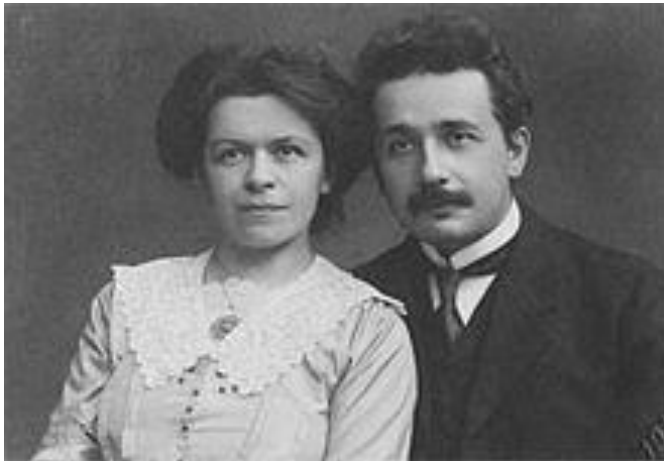
Mileva und Albert Einstein 1912

Erfahren können Sie von der wissenschaftlichen Recherche über ihr Leben und Romanen über sie.